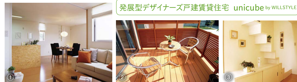
①広々としたLDKは、ライフスタイルに合わせて2部屋に分割できる ②暮らしの楽しみが広がる多目的なウッドデッキ ③玄関ホールはギャラリーにも