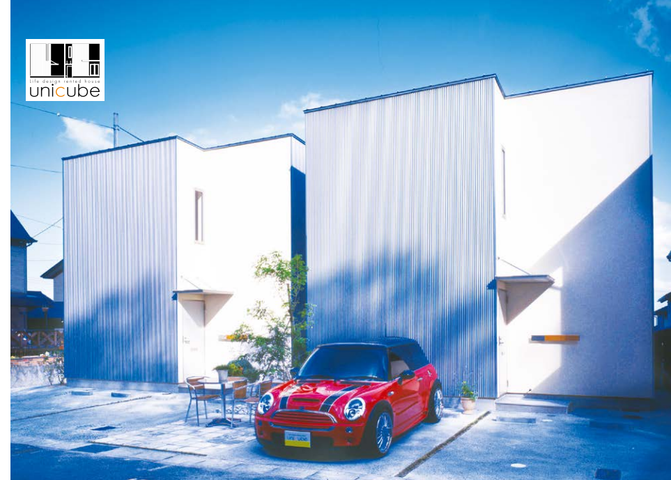
高いデザイン性を保ちながら、街並みに溶け込むシンプルで洗練された外観が特徴。街路側に窓を設けず、広いウッドデッキを設置。プライバシーを守りながら、開放的な空間をつくりあげている